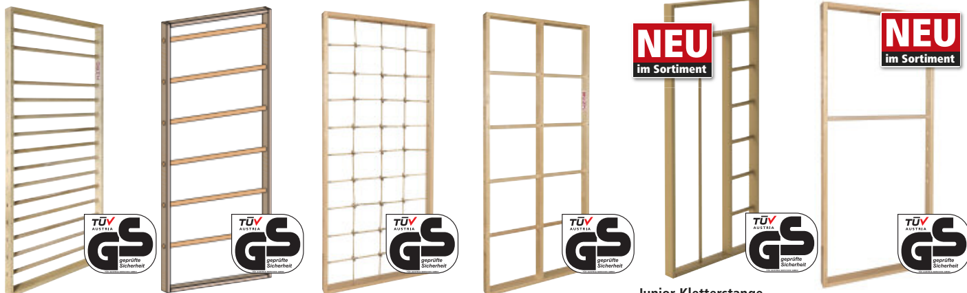
Junior Sprossenwand I Junior Sprossenwand III Junior Kletternetz Junior Gitterleiter Junior Kletterstange und Leiter Junior Reck 5472 424,60 78110 344,40 5476 628,40 5478 432,10 5474 473,10 78111 324,60