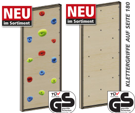
Junior Kletterwand mit Griffen Junior Kletterwand ohne Griffe 78112 611,70 78113 532,50