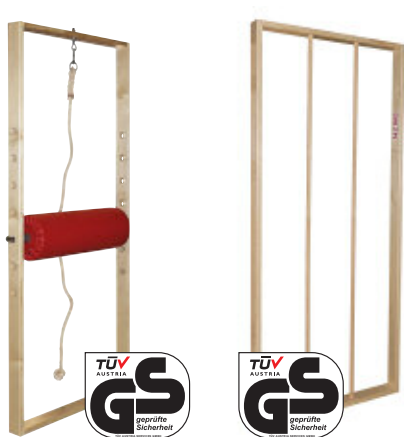
Junior Klettertau-Reck Junior Kletterstangen 5497 376,00 5477 343,70